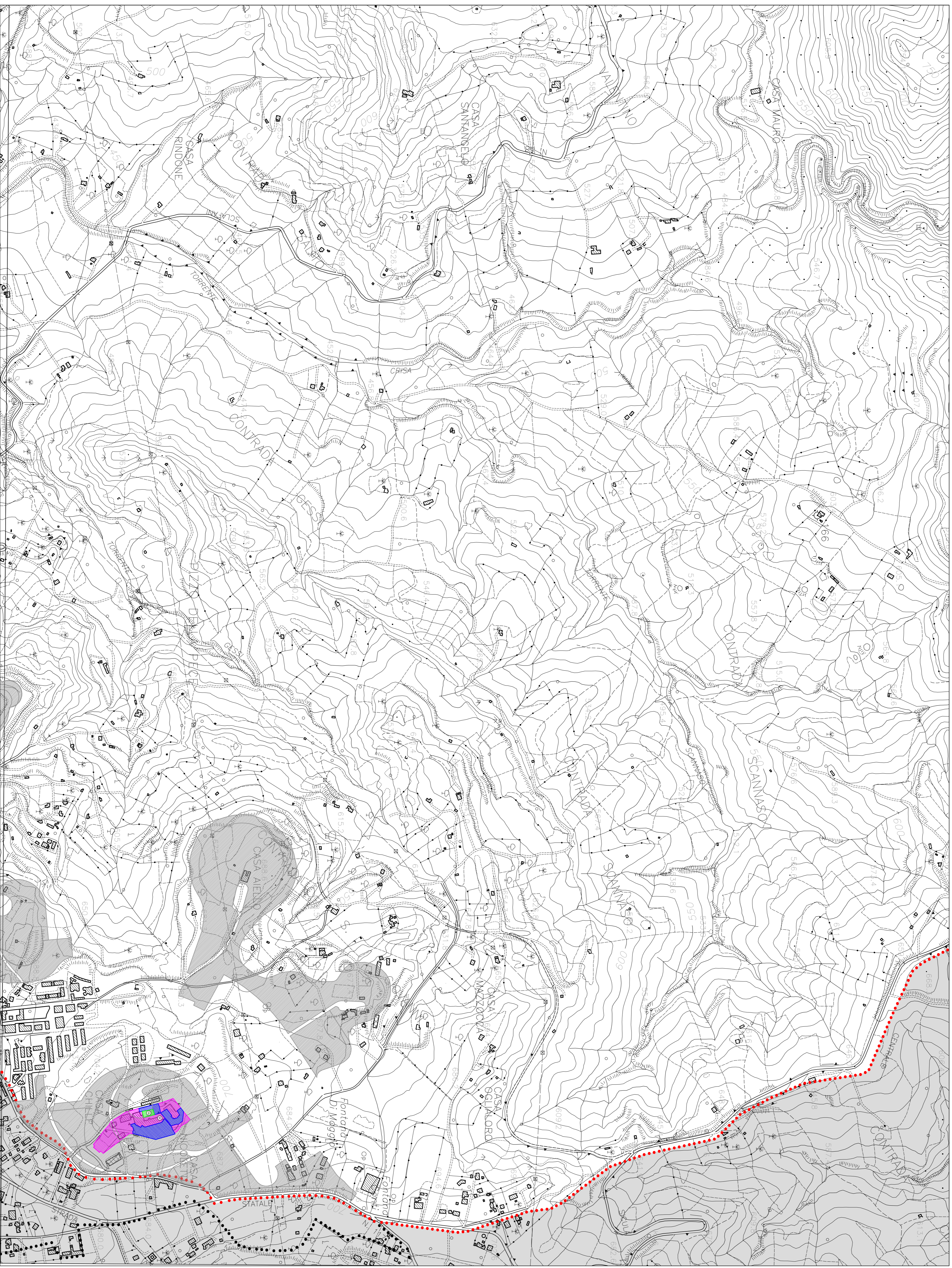
Il PRG contiene errori relativi allo sfaldamento delle cartografie. E' stato necessario un allineamento cartografico che riporta agli "orini posseduti" derivati dalla interpretazione del GIS.